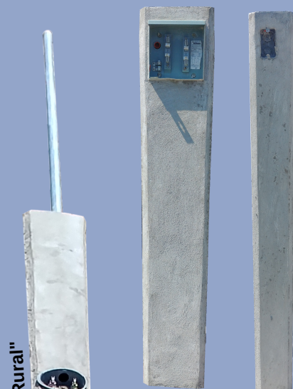
Murete "Base Cuadrada"