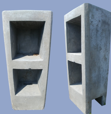
Murete "Aluminado Publico"